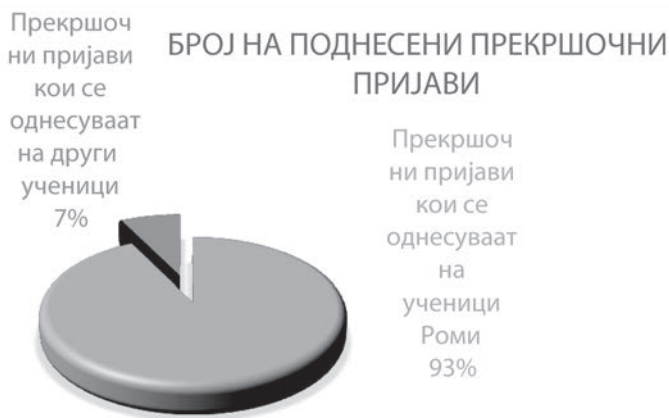
Графикон 1. Број на поднесени прекршочни пријави